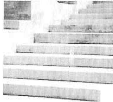
Es. per la scala